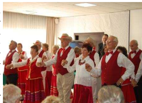
Występ Zespołu Złota Jesień z Giżycka podczas I Wojewódzkiej Konferencji z Okazji Międzynarodowego Dnia Seniora, Olsztyn, dn. 2-3.10.2008r.

Samorząd Województwa Warmińsko-Mazurskiego, mając na uwadze prognozy demograficzne, które przewidują, iż w roku 2030 ludność w wieku poprodukcyjnym w województwie warmińsko-mazurskim przekroczy 25% ogółu mieszkańców, widzi konieczność podjęcia interdyscyplinarnych działań zmierzających do przygotowania zarówno społeczeństwa, jak i samych seniorów do życia w zmieniających się uwarunkowaniach społeczno-ekonomicznych. W związku z dostrzeganym zapotrzebowaniem powstał Wojewódzki program na rzecz osób starszych na lata 2009-2013 „Pogodna i bezpieczna jesień życia na Warmii i Mazurach” .