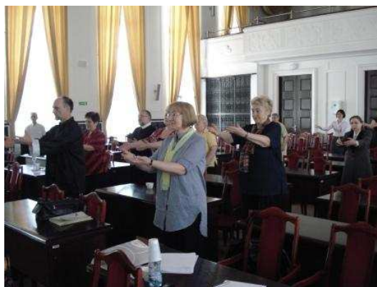
Pokaz ćwiczeń Tai Chi